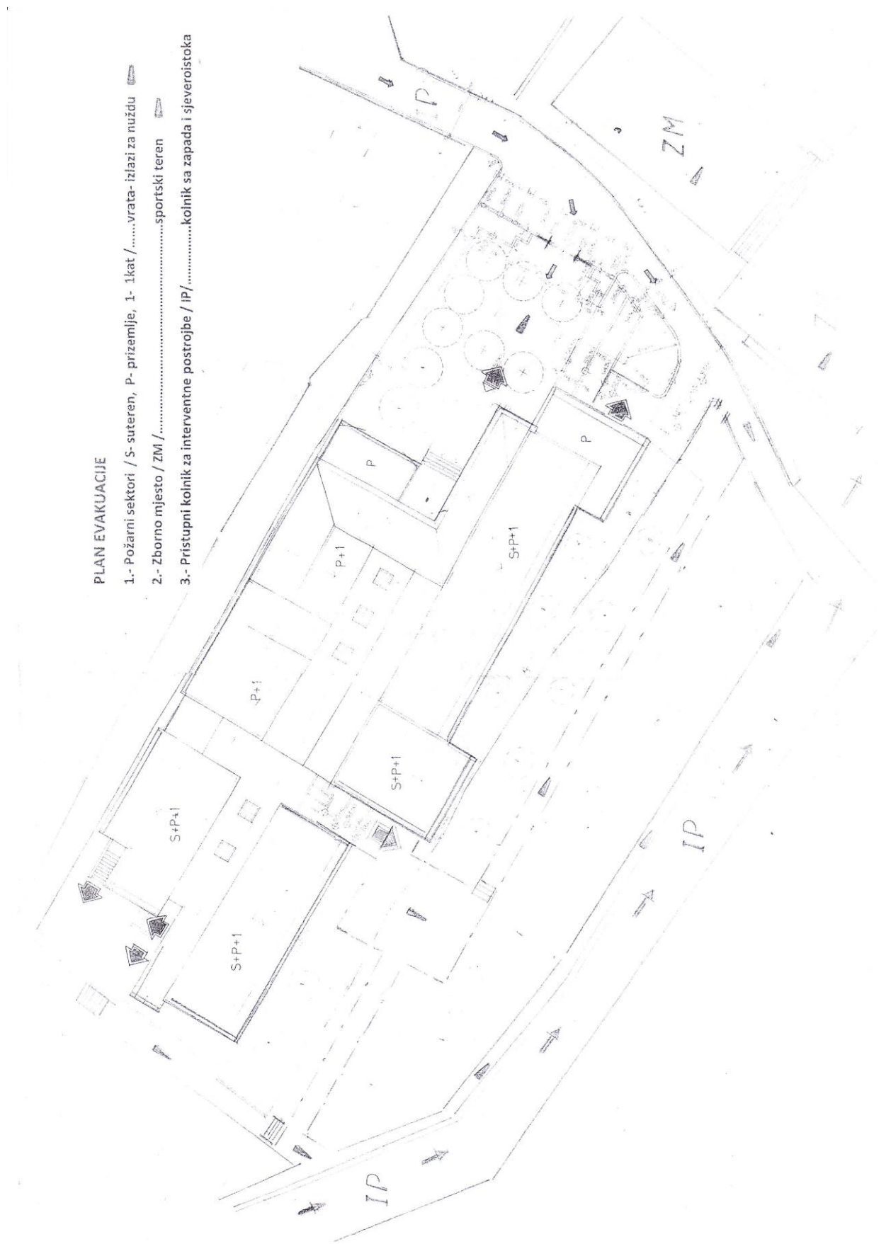
M. a.) GRAFIČKI PRIKAZ TLOCRTA ŠKOLE S DVORIŠTEM I ZBORNIM MJESTOM / ZM /