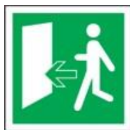
POMOĆNI IZLAZ - LIJEVO